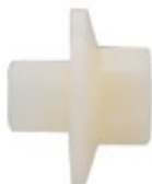
BUM műanyag anya